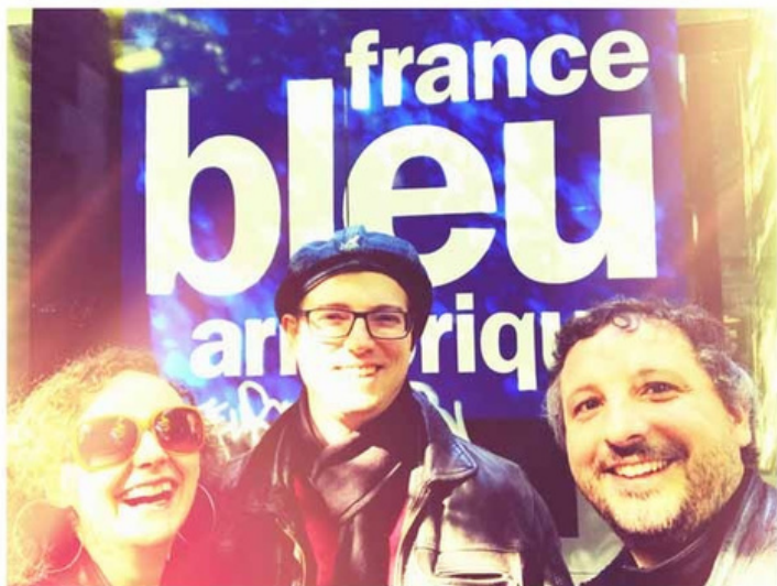
Les Talents Bretons AGATA!!!