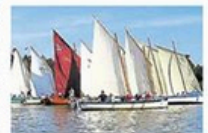
A la Grimaudière, des voiles qui contribuent à l'histoire de la belle plaisance sur l'Erdre.

Le club nautique chapelain de l'Ancre est partenaire des Rendez-vous de l'Erdre. Après la nuit de vendredi à samedi passée au port de Sucé-sur-Erdre, les bateaux repartiront en régata, dès samedi matin, en direction de La Chapelle-sur-Erdre. La flottille fera escale, entre 12 h et 15 h, à la base nautique de la Grimaudière (du club de l'Ancre), donnant l'occasion au public de venir découvrir ces bateaux qui ont fait l'histoire de la belle plaisance sur l'Erdre : des bateaux à vapeur ou à hélice, des embarcations voile-aviron (voile et rames) ou encore des dériveurs et des quillards (suivant que la quille soit amovible ou non). C'est au son d'un orchestre de jazz que les quelque 350 navigateurs sont attendus pour la pause déjeuner sur les pelouses du club chapelain. Le public pourra également pique-niquer sur la base nautique, où un stand de petite restauration les attend, tout en admirant ces voiliers. Puis, à 15 h, la flottille repartira vers Nantes, jusqu'au bassin Ceineray.