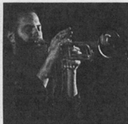
Le trompettiste Avishai Cohen.

Du 8 au 26 novembre , à la MJC Bréquigny. Renseignements : 02 99 86 95 95, retrouvez l'ensemble de la programmation sur www.jazza-louest.com