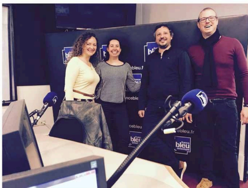
L'album de la semaine: AGATA «French Connection» sur France Bleu Armorique du 7 au 13 mai 2018 !