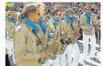
La Fabric'A Mambo, superbe fanfare salsa géante de trente musiciens.