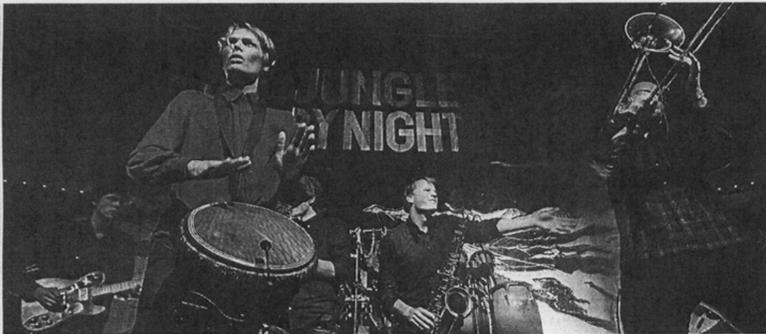
Jungle by night, une formation déjantée venue d'Europe du Nord.

Du 8 au 26 novembre, aura lieu la 27 e édition du festival organisé par la MJC Bréquigny, pour favoriser le dialogue entre les cultures. Des concerts seront proposés dans une vingtaine de lieux.