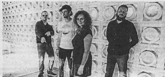
Le groupe rennais Agata quartet.